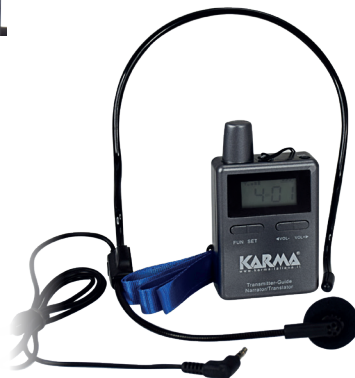
Trasmittente TG 100TX