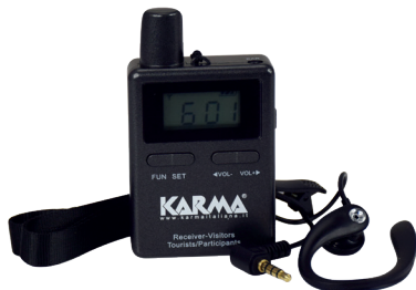
Ricevente TG 100RX