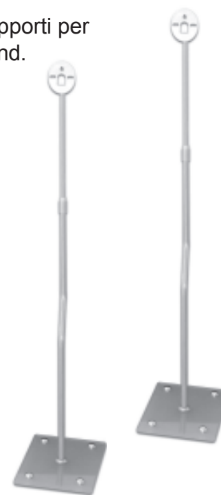
Schema di montaggio