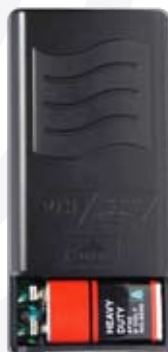
Esempio di inserimento batteria nel lavalier del mod. SET 7022PL

Una volta completati questi passaggi siete pronti per utilizzare il vostro nuovo apparecchio.