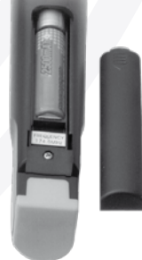
Esempio di inserimento batteria nel radiomicrofono palmare