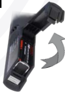
Esempio di inserimento batteria nel radiomicrofono palmare