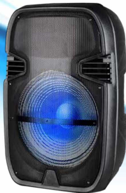
RICEVENTE: BM 108RX - BM 115RX