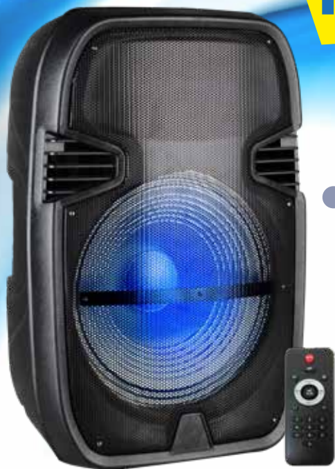
TRASMITTENTE: BM 108TX - BM 115TX